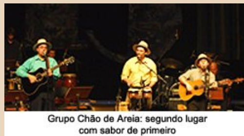
Grupo Chão de Areia: segundo lugar com sabor de primeiro