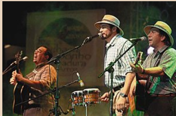
O trio de gaúchos que levou prêmios de segundo lugar e aclamação popular