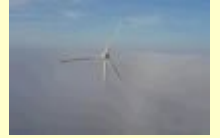
Imagem de fundo: Parque Eólico de Osório - Aerogeradores

paulodecampos@cantadoresdolitoral.com.br