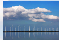
Imagem de fundo: Parque Eólico

O GRUPO CANTADORES DO LITORAL FOI O VENCEDOR DA CATEGORIA GRUPO DE SHOW E A CANTORA LOMA A VENCEDORA DA CATEGORIA CANTORA DA 4ª EDIÇÃO DO PRÊMIO VITOR MATEUS TEIXEIRA 2009 INSTITUÍDO PELA ASSEMBLÉIA LEGISLATIVA DO ESTADO DO RIO GRANDE DO SUL.