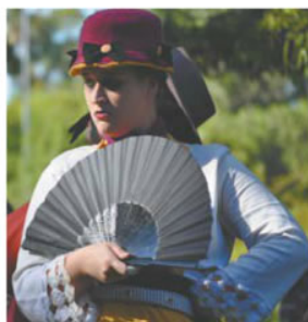
Cenas do espetáculo "O Baile dos Anastácio, do grupo Oigalê

O grupo: A Oigalê Cooperativa de Artistas Teatrais surgiu em 1999 e, desde então, mantém um trabalho contínuo e de pesquisa. Ao longo destes anos produziu os espetáculos: 1999 – Deus e o Diabo na Terra de Miséria; 2001 – Mboitatá, a Verdadeira História da Cobra de Fogo dos Pampas; 2001 – Cara Queimada; 2002 – O Negrinho do Pastoreiro; 2005 – A Máquina do Tempo; 2006 – Uma Aventura Farroupilha; 2008 – Miséria Servidor de Dois Estancieiros; 2009 – Era Uma Vez... uma fábula assombrosa; Em 2002 a Oigalê gravou um CD com a trilha sonora dos três espetáculos sobre