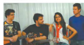
Grupo Cordas & Rimas