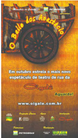
Cartaz do grupo Oigalê

O festival de teatro Art In Vento, promovido pela Secretaria de Cultura de Osório, começa na parte da manhã da segunda-feira dia 21 de outubro no Plenário da Câmara de Vereadores e se estende por toda a semana nos turnos da manhã tarde e noite, com as peças concorrentes. Porém, a abertura oficial se dá no Largo dos Estudantes, dia 21 a partir das 20 horas com a apresentação do Grupo Cordas & Rimas e Irmãos Grimm; e das 21 horas com o espetáculo "O Baile dos Anastácio" com a Oigalê Cooperativa de Artistas Teatrais.