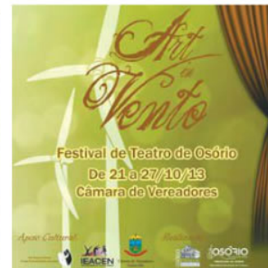
Cartaz oficial do Art in Vento 2013