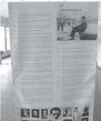
Painel mostrando a cronologia de Drummond