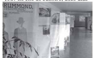
Dezesseis painéis ilustrados formam a exposição

No mesmo ano em que publica a primeira obra poética, "Alguns poemas" (1930), o seu poema Sentimental é declamado na