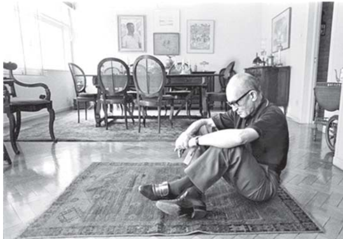
Carlos Drummond de Andrade

nacional. Este ano o projeto retrata a vida e a obra do escritor mineiro Carlos Drummond de Andrade .