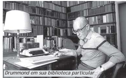
Drummond em sua biblioteca particular

Nascido há 111 anos, Drummond é a 12ª personalidade homenageada pelo Projeto Memória , desde seu lançamento em 1997, que visa difundir, junto a professores, alunos da rede pública de ensino, historiadores e formadores de opinião, a obra de grandes nomes que contribuíram para a transformação social do país e a formação da identidade cultural brasileira.