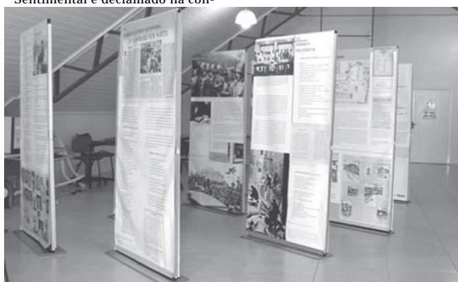
Exposição está na Biblioteca Municipal

Av. Getúlio Vargas, 831 (ao lado da Loja Clic Veículos) Fones: (51) 3663 7854 / (51) 9992.5181