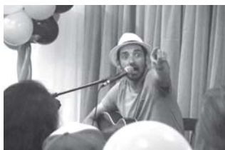
Prates interagindo com o público

O Zuando Som é um projeto que busca transformar em música quase tudo que envolve a infância, aproximando crianças e adultos, fazendo lembrar a importância da brincadeira para a formação de pessoas felizes, em todas as idades. São canções que falam das crianças e para as crianças, respeitando e valorizando o universo infantil. O projeto foi criado pelo músico e com-