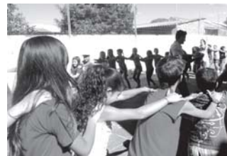
Atividades lúdicas envolvendo música e contação de histórias são os pontos fortes do projeto Zuando Som, que iniciou em 2004

o nascimento do primeiro filho. Logo foi convidado a promover encontros de música nas escolas infantis das cidades de Osório, Imbé e Tramandaí. Depois de alguns anos tocando sozinho em Feiras de Livro do estado gaúcho, formata com a